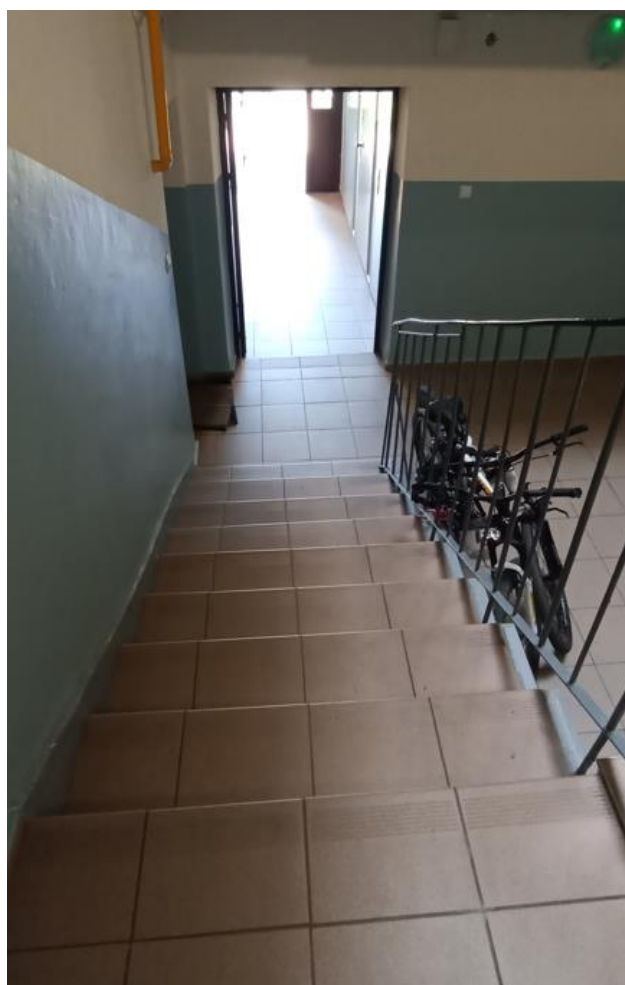
Widok z klatki schodowej na wyjście z budynku