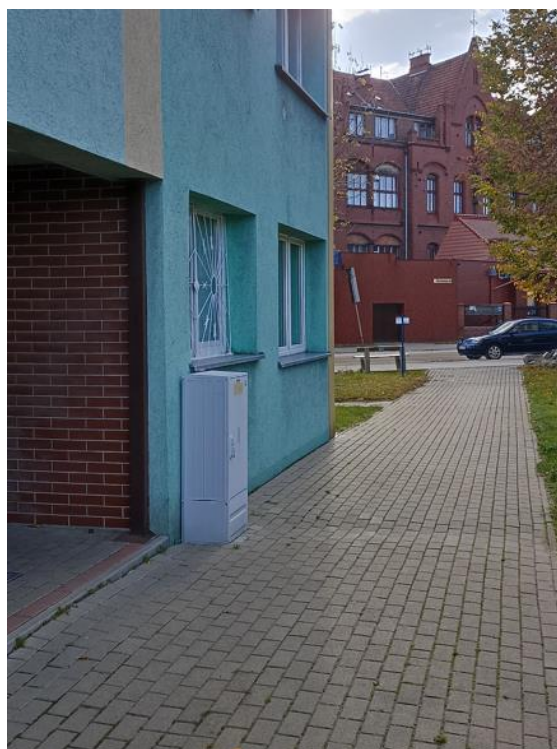
Dojście do budynku