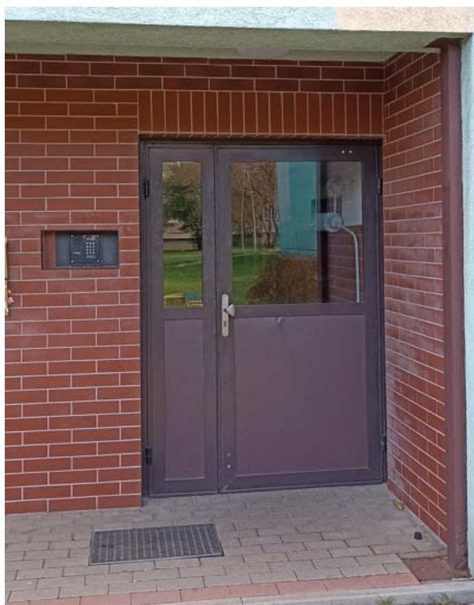
Wejście do budynku