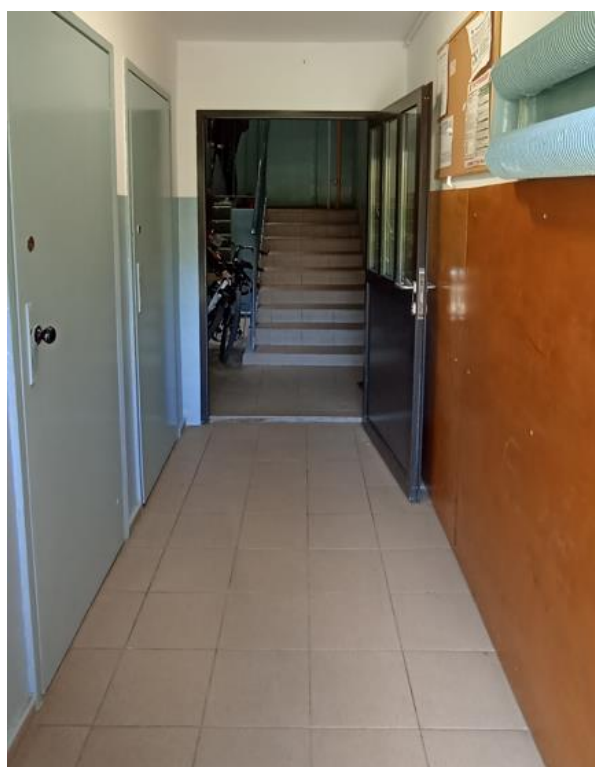
Dojście do klatki schodowej