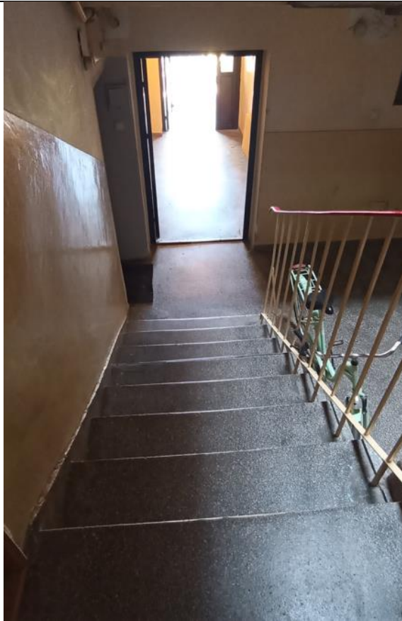
Widok z klatki schodowej na wyjście z budynku