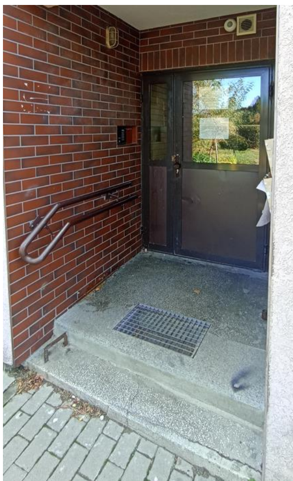
Wejście do budynku