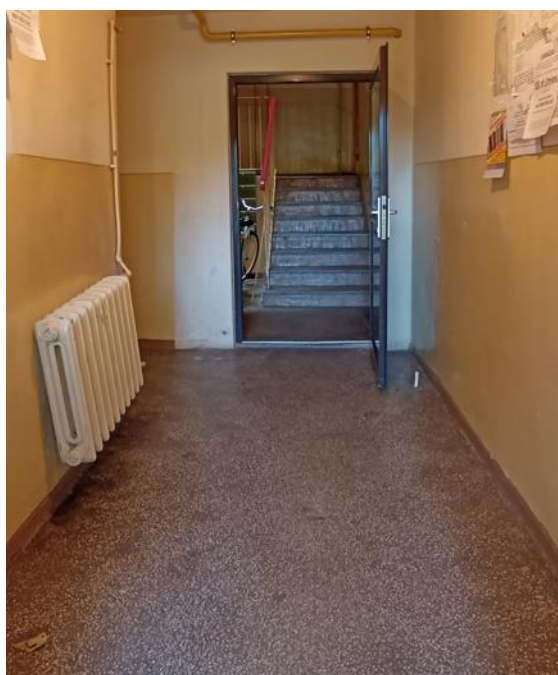
Dojście do klatki schodowej