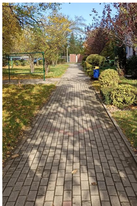
Dojście do budynku