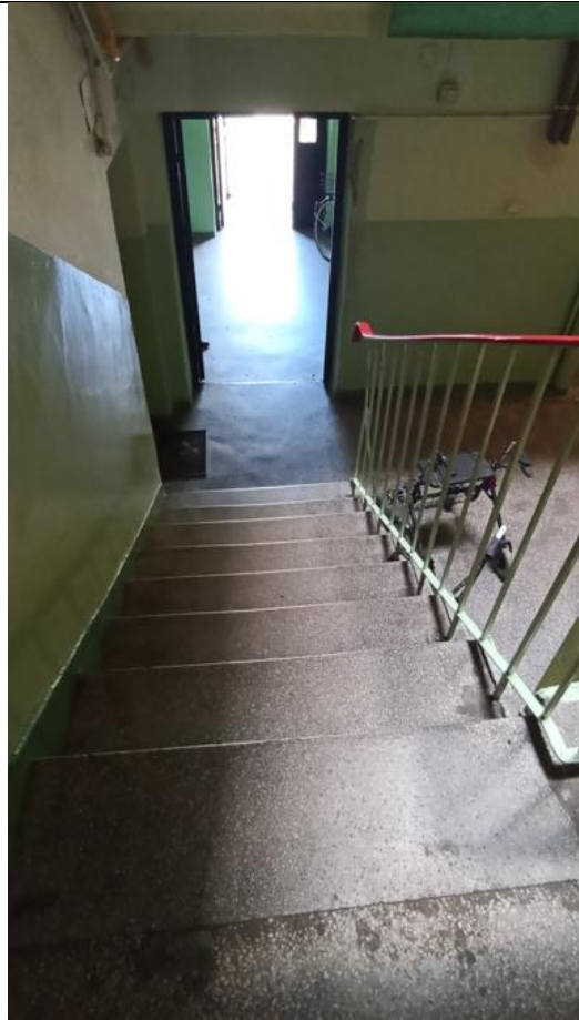
Widok z klatki schodowej na wyjście z budynku