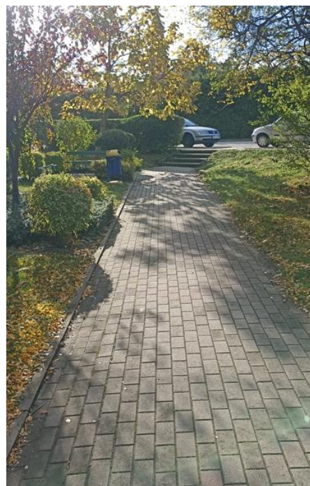
Dojście do budynku