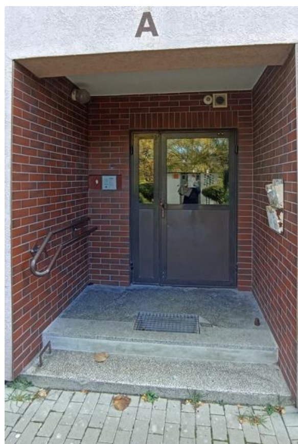
Wejście do budynku