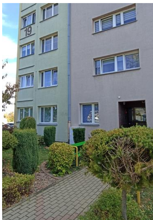
Dojście do budynku