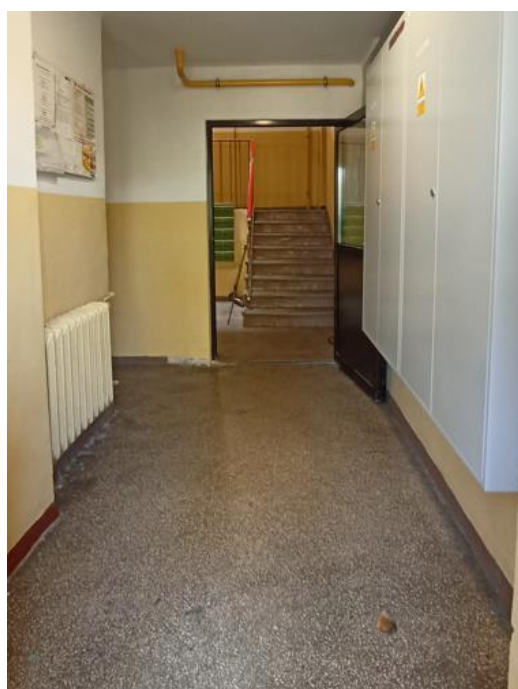
Dojście do klatki schodowej