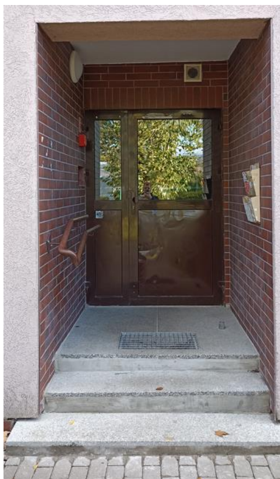
Wejście do budynku