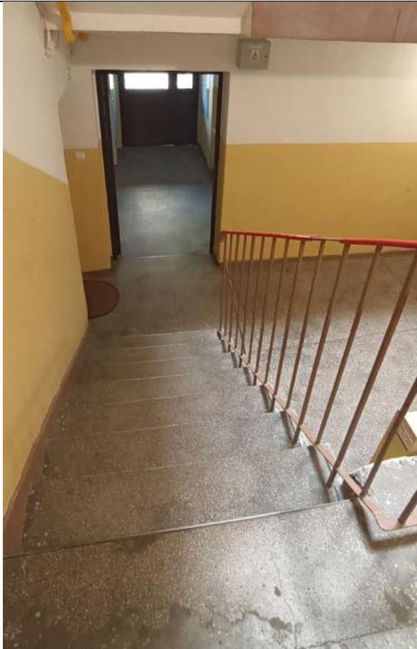
Widok z klatki schodowej na wyjście z budynku