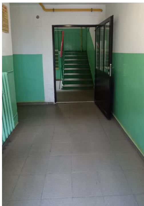
Dojście do klatki schodowej