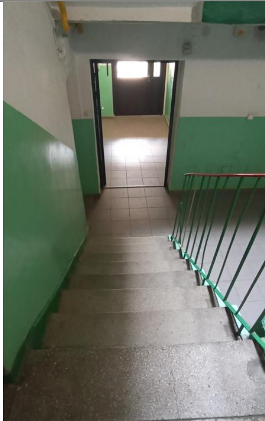
Widok z klatki schodowej na wyjście z budynku