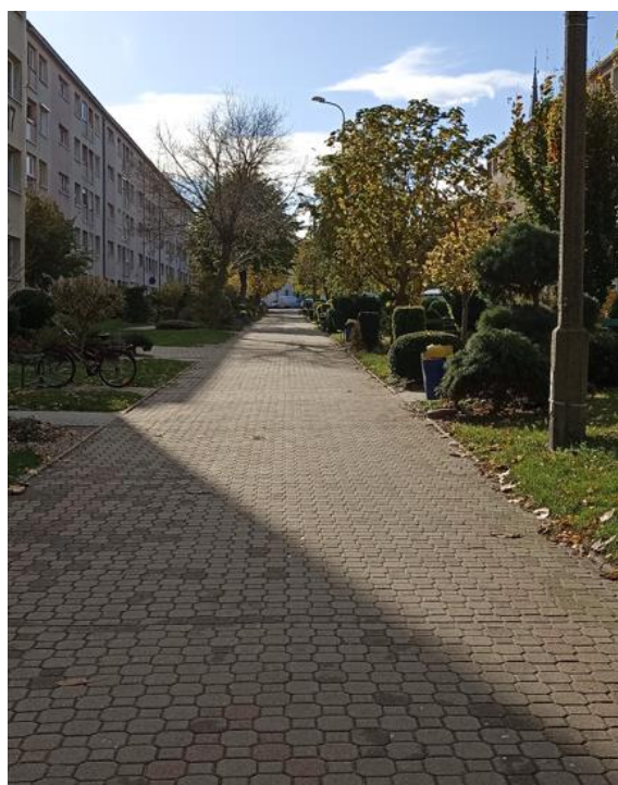
Dojście do budynku