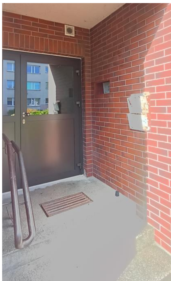
Wejście do budynku