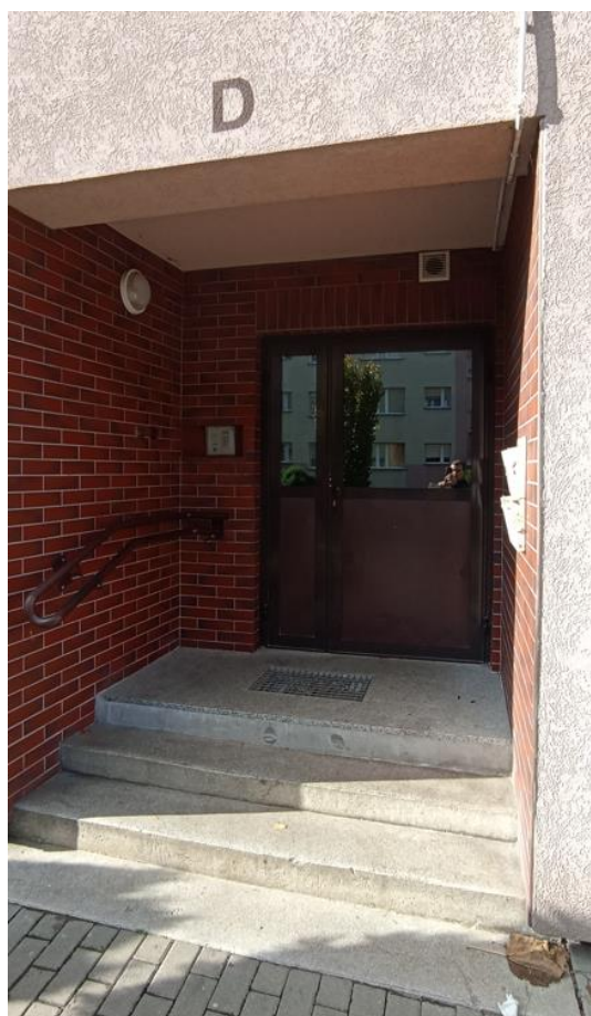
Wejście do budynku