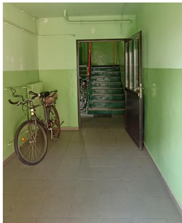
Dojście do klatki schodowej