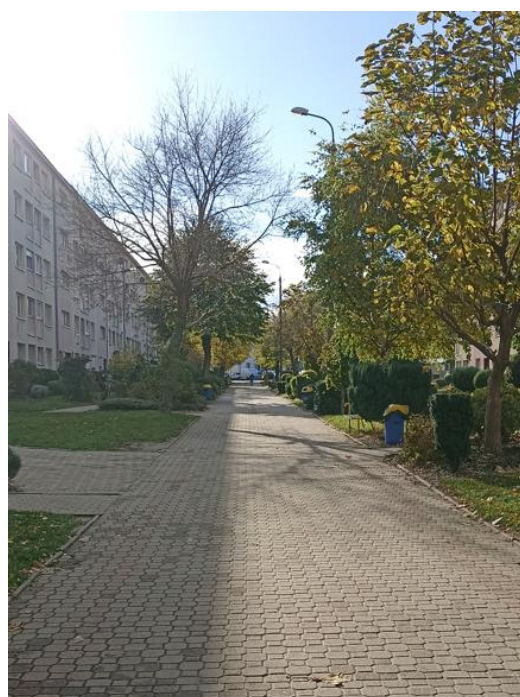
Dojście do budynku