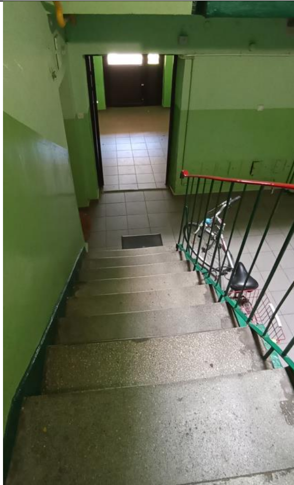
Widok z klatki schodowej na wyjście z budynku