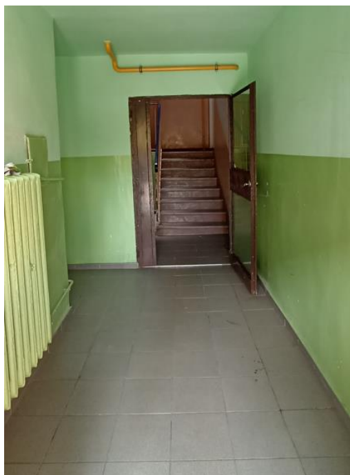
Dojście do klatki schodowej