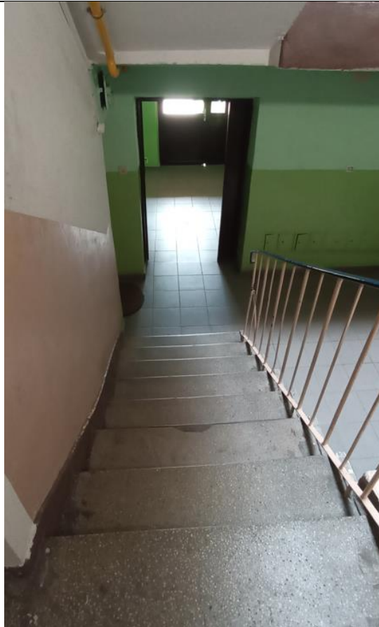
Widok z klatki schodowej na wyjście z budynku