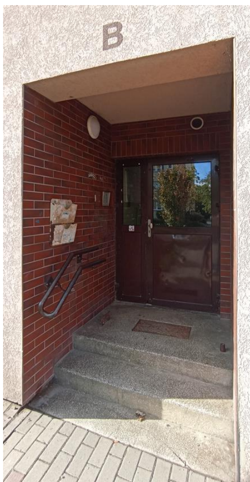
Wejście do budynku