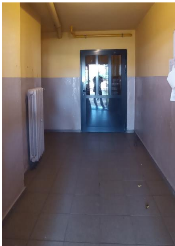
Dojście do klatki schodowej