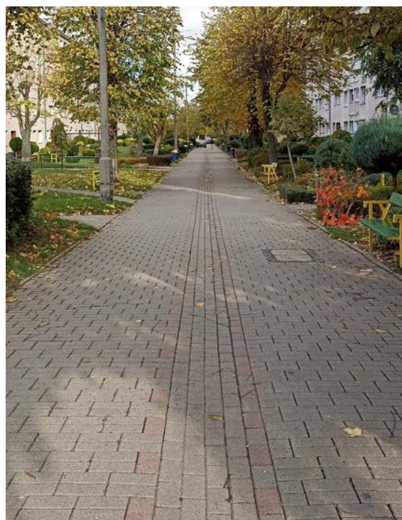
Dojście do budynku