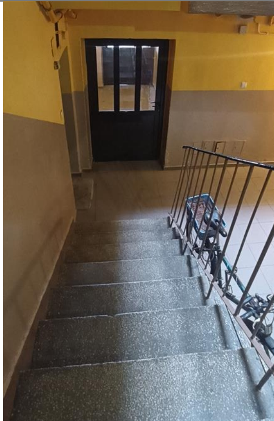
Widok z klatki schodowej na wyjście z budynku