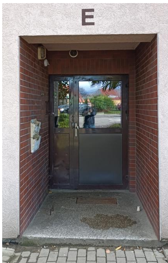
Wejście do budynku