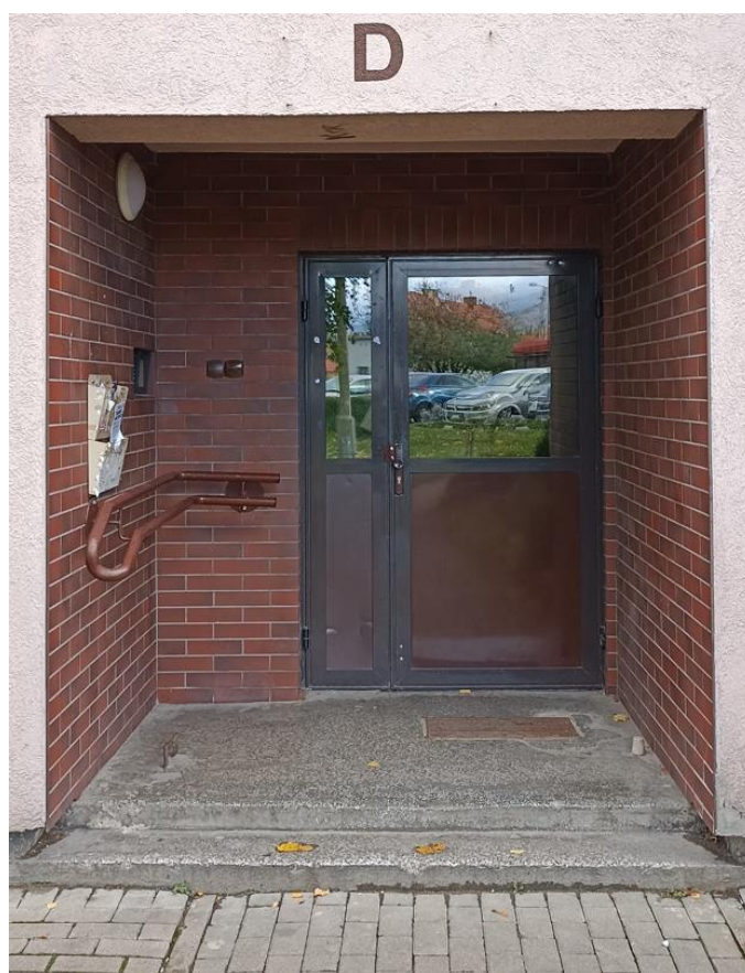
Wejście do budynku