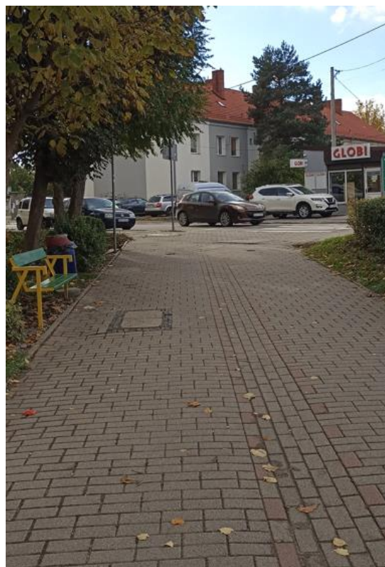
Dojście do budynku