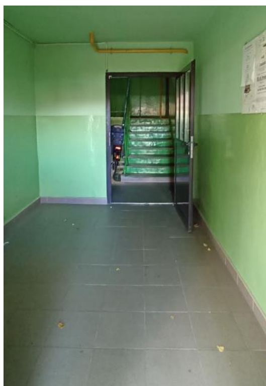
Dojście do klatki schodowej