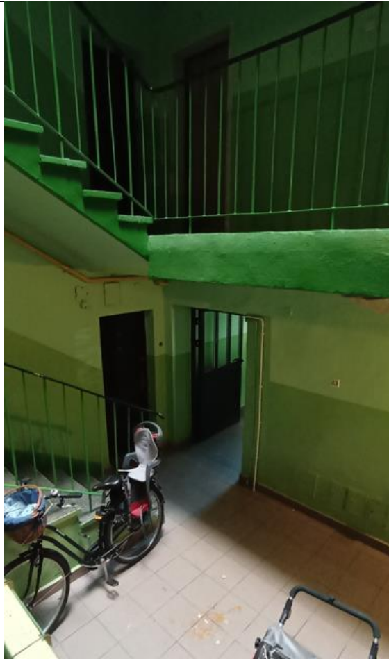
Widok z klatki schodowej na wyjście z budynku