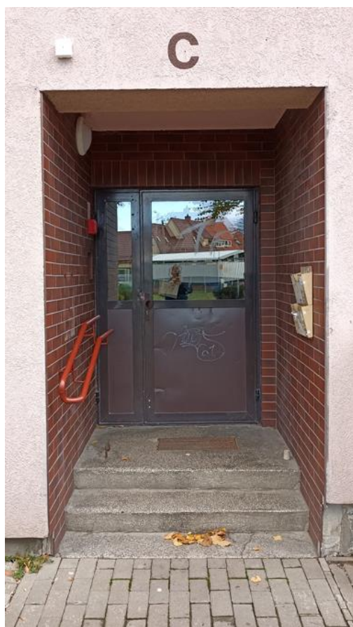
Wejście do budynku