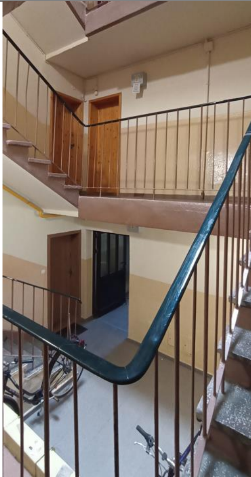
Widok z klatki schodowej na wyjście z budynku