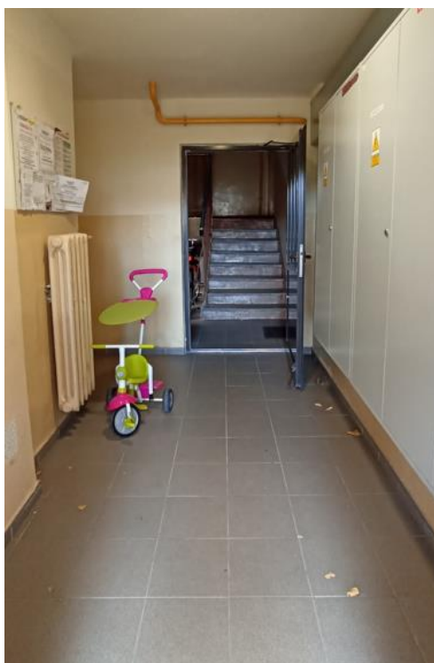
Dojście do klatki schodowej