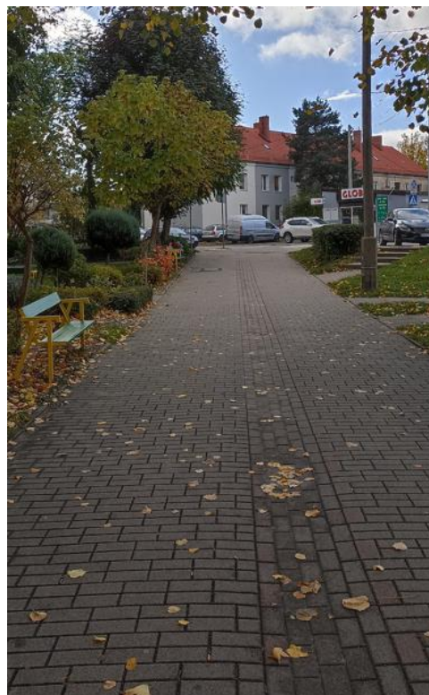
Dojście do budynku