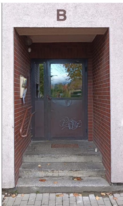
Wejście do budynku