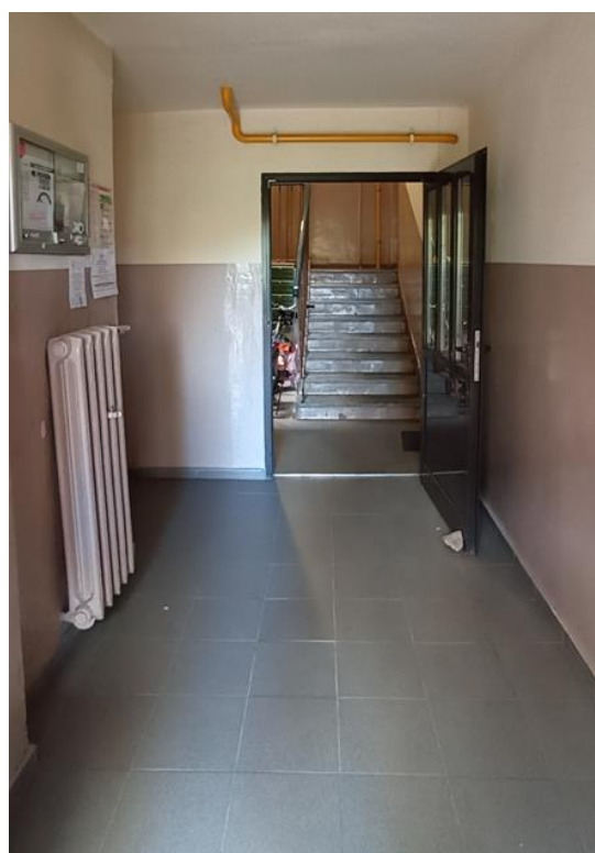
Dojście do klatki schodowej