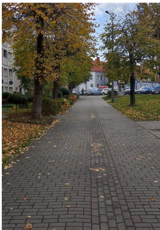
Dojście do budynku