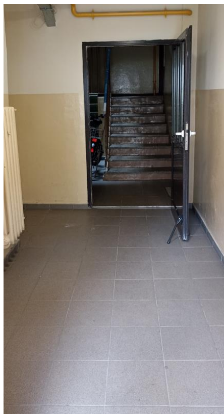
Dojście do klatki schodowej