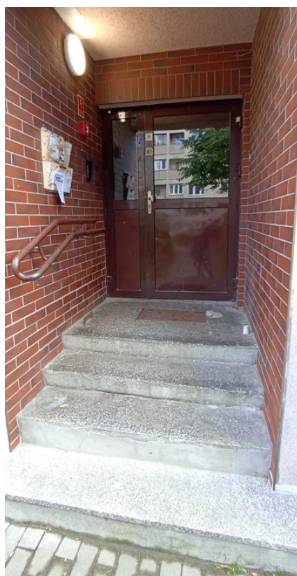
Wejście do budynku