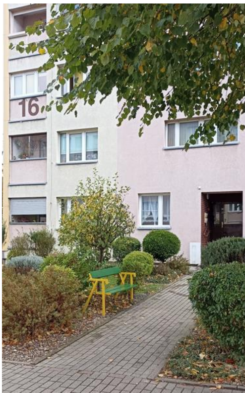
Dojście do budynku